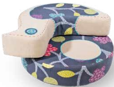
001935537-0004; spilveni sēdēšanai; MY PLACE, SIA

Reģistrējot dizainparaugu, tiek iegūtas izņēmuma tiesības. Galvenais šo tiesību saturs ir tiesības aizliegt citām personām izgatavot (ražot), piedāvāt tirdzniecībai, importēt, eksportēt, lietot vai uzglabāt šiem nolūkiem jebkuru tādu izstrādājumu, kurš uz informētu lietotāju neatstāj no reģistrētā dizainparauga atšķirīgu kopiespaidu.