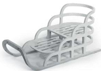
DM/079054; ragaviņas; BRAMBLING, SIA

Ja kāda trešā persona uzskata, ka dizainparauga reģistrācija veikta pretlikumīgi (tas nav jauns, tam nav individuāla rakstura vai tml.), tā var lūgt EUIPO, lai reģistrāciju atzīst par spēkā neesošu (pieteikums spēkā neesamības pasludināšanai, anulēšanas procedūra). Tiesa prasību par reģistrēta Kopienas dizainparauga atzīšanu par spēkā neesošu izskata, ja tā iesniegta kā pretprasība dizainparauga pārkāpuma tiesvedībā. Ja šāds pieteikums vai prasība ir pamatota, reģistrētais dizainparaugs var tikt atzīts par spēkā neesošu. Latvijā strīdus par Kopienas dizainparaugu tiesību pārkāpumiem un spēkā esamību izskata Rīgas pilsētas Vidzemes priekšpilsētas tiesa (pirmā instance) un Rīgas apgabaltiesa (otrā instance).