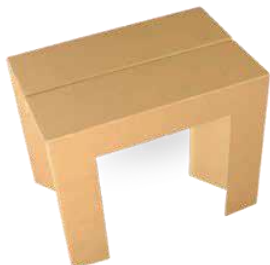
000335831-0002; galds; VĒJIEM LĪDZI, SIA

Dažos gadījumos pieteicējam ir svarīgi, lai reģistrētais dizainparaugs tiktu publicēts vēlāk, piemēram, modes precēm – noteiktā sezonā. Pieteikuma iesniegšanas brīdī iespējams lūgt publikācijas atlikšanu uz 30 mēnešiem no pieteikuma datuma (vai prioritātes datuma, ja izmantota prioritāte). Par publikācijas atlikšanu paredzēta īpaša maksa. Šajā gadījumā dizainparaugs tiek reģistrēts, bet attēlus publicē un datubāzē ievieto tikai datumā, kad ir beidzies minētais 30 mēnešu termiņš, vai agrāk – kad to lūdz pieteicējs.